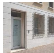
Lo sportello Donna a Marano

Durante la settimana saranno inoltre pubblicati online i lavori del concorso "Crea un logo per lo sportello Donna" e degli spunti di