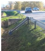
Il punto dell'uscita di strada

sanitari del Suem 118 arrivati con un'ambulanza da Lonigo.