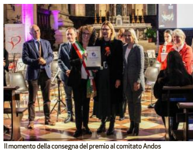
Il momento della consegna del premio al comitato Andos