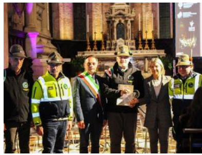
La sezione Ana "Monte Pasubio" è l'associazione cittadina dell'anno

«Questo è il momento più bello, quello del grazie e della condivisione. Siamo felici di organizzare questa serata proprio per la conclusione dell'anno, è un modo di pensare già con speranza ai nuo-