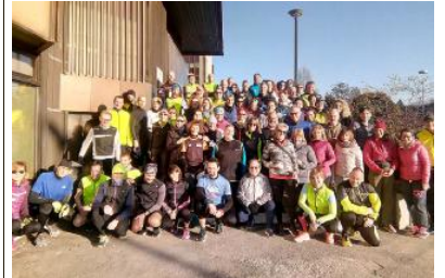
Il gruppo di runners di "Corri x Vicenza" che si è ritrovato anche ieri

"CORRI PER VICENZA". Inaugurato il nuovo anno